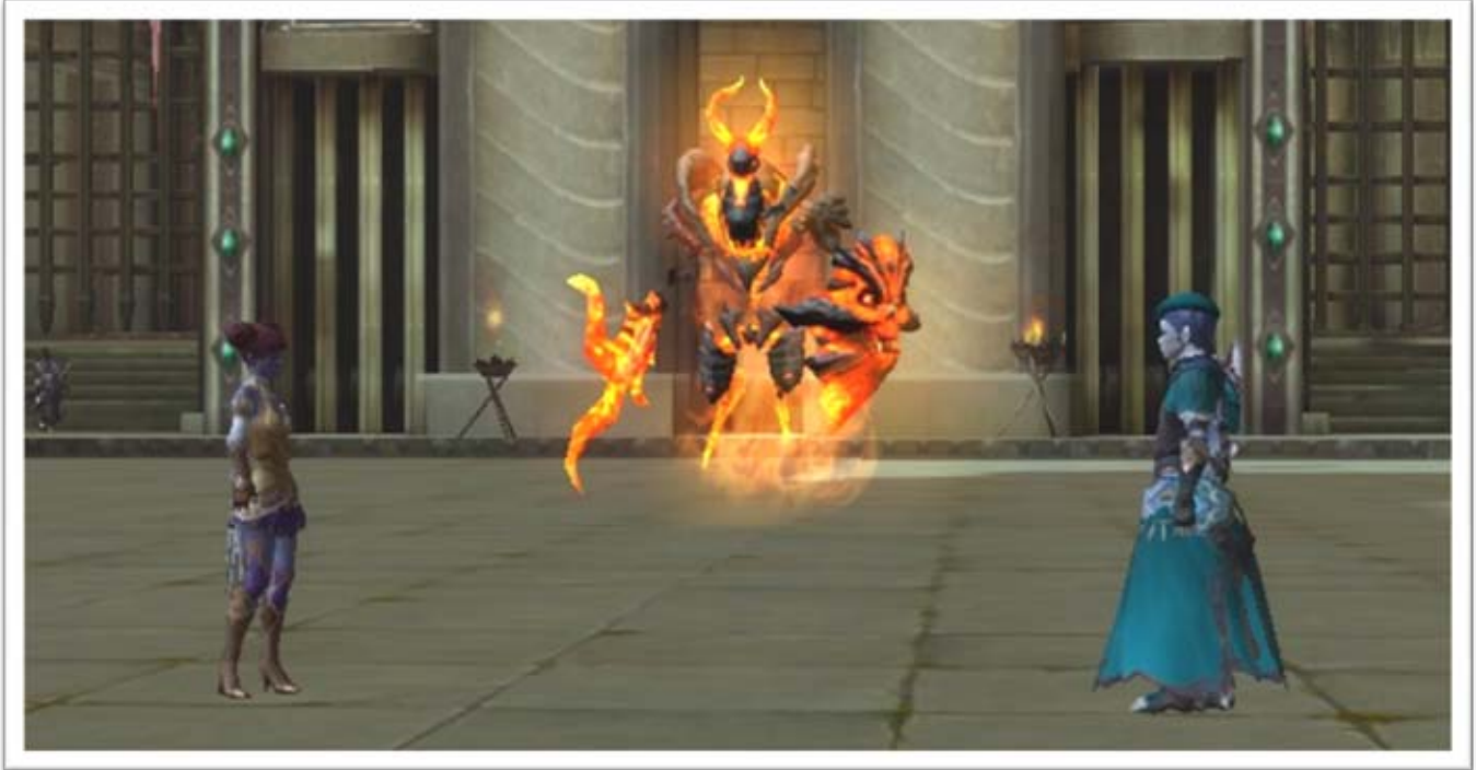
Elli, die Sonne und Asmo