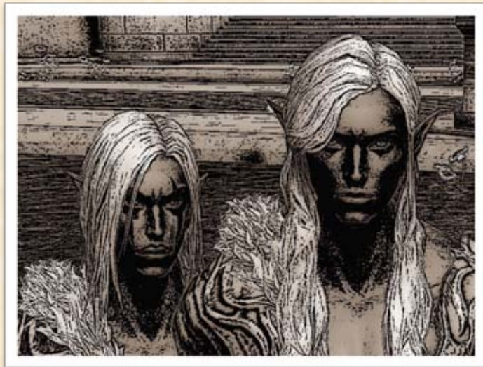
Skizze der Entführer nach den Angaben des Lord

Derweil traf eine Lösegeldforderung über 10 Millionen Kinah beim Bruder des Lords ein, da alle Spuren soweit im Schnee Altgards verschwunden waren, ging man auf diese Forderung ein. Nach erfolgter Übergabe, folgte ein Mitglied des Hauses den Entführern, während sich der Rest der Verfolger auf die Suche nach Lord Daeron Maerdyn machten. Die Entführer hatten den Hinweis gegeben, dass sich der Lord in einer Kiste an einem Wasserfall befände und man sich besser beeilen würde, ihn zu finden, denn sollte die Kiste den Wasserfall hinabstürzen, bevor man ihn findet, würde der ebenfalls darin eingeschlossene Kisk für einige Unannehmlichkeiten beim Lord sorgen. Glücklicherweise konnte man die Kiste und den darin Eingeschlossenen bergen. Die Verfolger der Entführer berichteten, dass diese in Verbindung mit den Leparisten in Ishalgen standen, von diesen aber um die zehn Millionen Kinah betrogen wurden. Zuletzt sah man das Geld an Bord eines Leparistenschiffes.