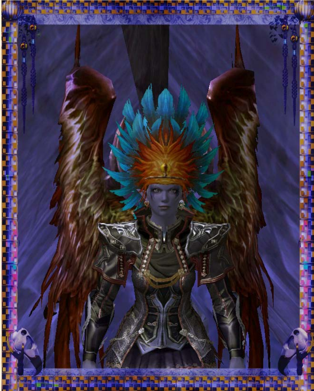
Bild zu 2 - Kettenset des korrupten Richters ohne Helm (weibliche Variante)

Anmerkung: Die im Bild dargestellte Krone der Flammenfeder ist nicht Bestandteil dieses zur Versteigerung stehenden Rüstungspaketes!