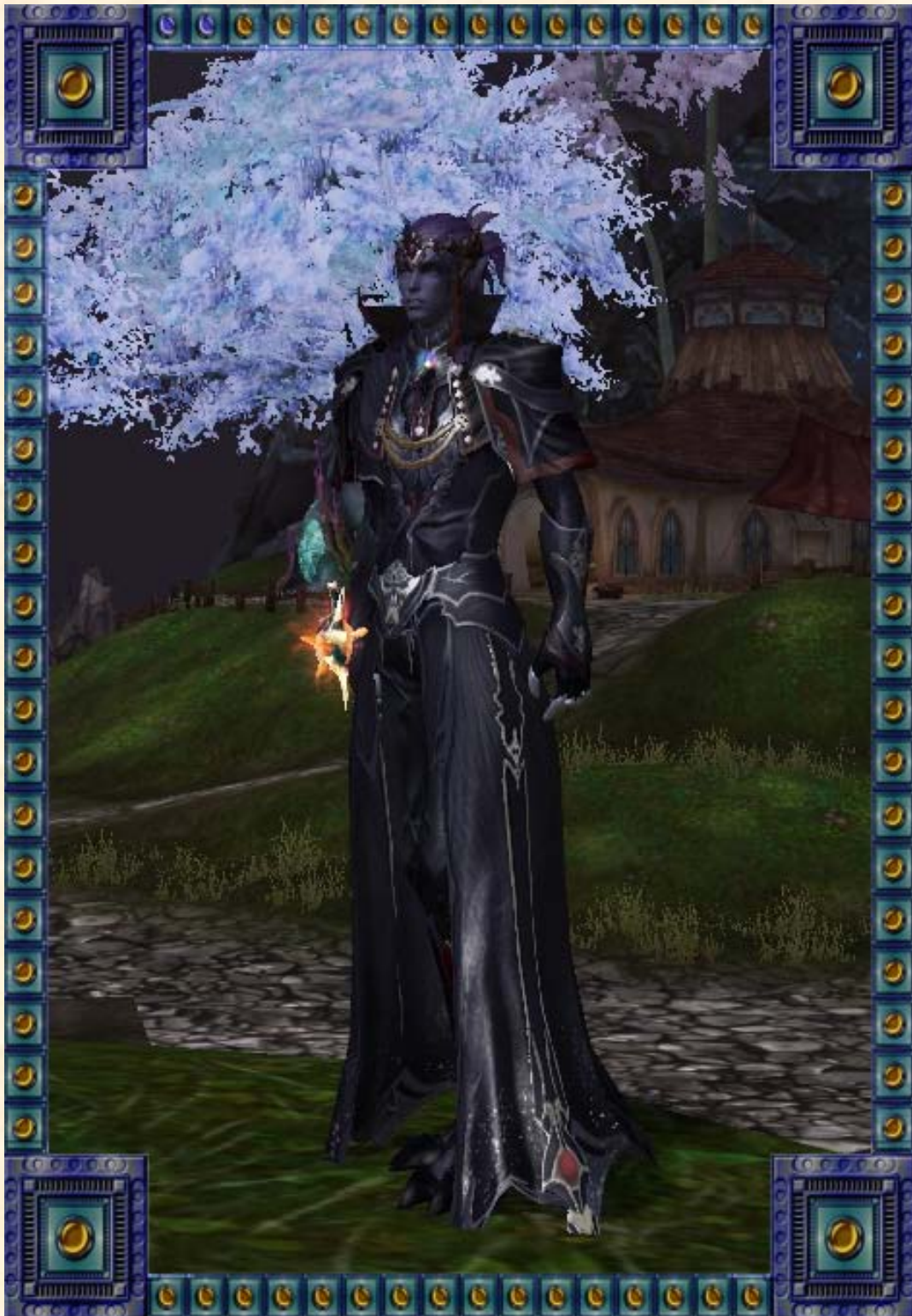
Bild zu 2 - Stoffset des korrupten Richters ohne Helm (männliche Variante)

Anmerkung: Die im Bild dargestellte Kopfbedeckung und die Waffe sind nicht Teil dieser Auktion!