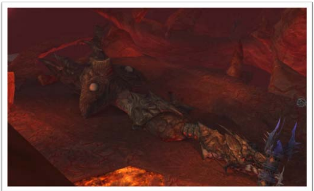
Das zerstörte Balaurschlachtschiff

Wie inzwischen bekannt ist, verdanken wir den Abschuss des Schiffes dem Präsidenten und nun Besitzer von Atreia – Balder Zaphod Beeblebrox und seinem Schiff, der „Herz aus Gold“.